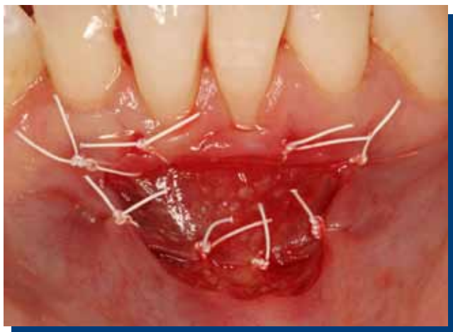
Figura 3. Membrana de matriz extracelular derivada de submucosa del tejido del intestino delgado de origen porcino (Dynamatrix®) suturada en lecho quirúrgico.