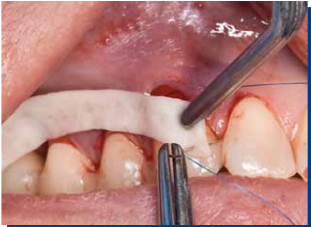
Figura 1. Matriz dérmica acelular.