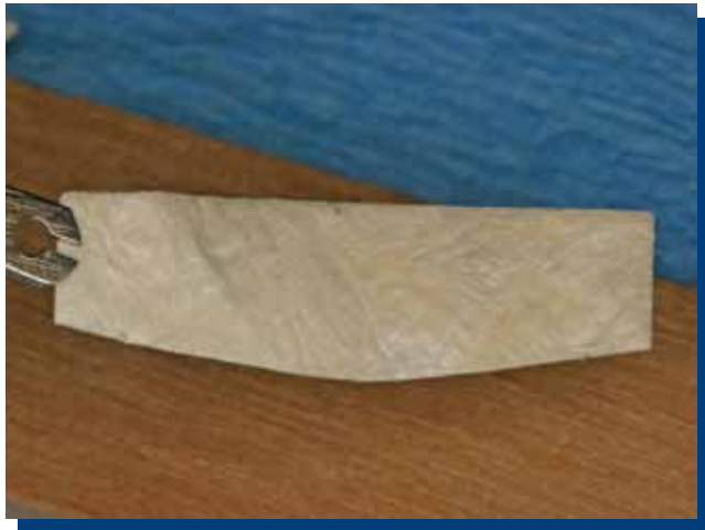
Figura 2. Membrana de matriz extracelular derivada de submucosa del tejido del intestino delgado de origen porcino (Dynamatrix®) recortada y lista para colocación en lecho quirúrgico.